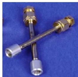
Dispositivo de muestreo pasivo

Si le tomaron una muestra antes de 2016 con un dispositivo de muestreo de 24 horas, le recomendamos que se registre para tomar el muestreo con el nuevo dispositivo pasiva de 26 días, ya que puede determinar con mayor precisión si se está produciendo una intrusión de vapor en su hogar.