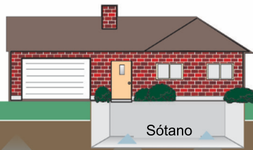
Agua Subterránea Contaminada

Los vapores del agua subterránea pueden evaporarse en el suelo y llegar a las casas a través de grietas y huecos en el sótano o la fundación.